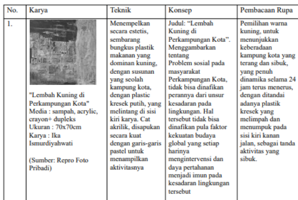
Tabel pembagian klasifikasi karya

Pada karya-karya yang dipamerkan dengan tema 'Transformation', terdapat 12 (dua belas karya), yang terbagi dalam tiga bagian penggarapan konsep dan teknis. Hal ini dapat kita amati dari tiga hal tersebut, dari tabel berikut.