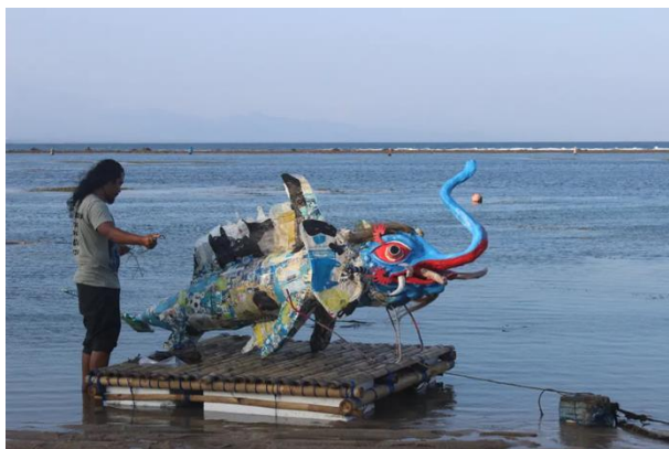
Gambar 2. Made Bayak: Plasticology (2018)

ekologis plastik—penyebarannya, persistensinya, dan gangguannya terhadap ekosistem (Hale dkk., 2020). Plastikologi mengartikulasikan estetika limbah sebagai alat pedagogis dan protes ekologis, menerjemahkan pengetahuan lingkungan ke dalam narasi keberlanjutan partisipatif.